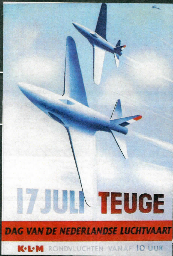
Affiche voor een vliegfeest op vliegveld Teuge uit de jaren veertig.