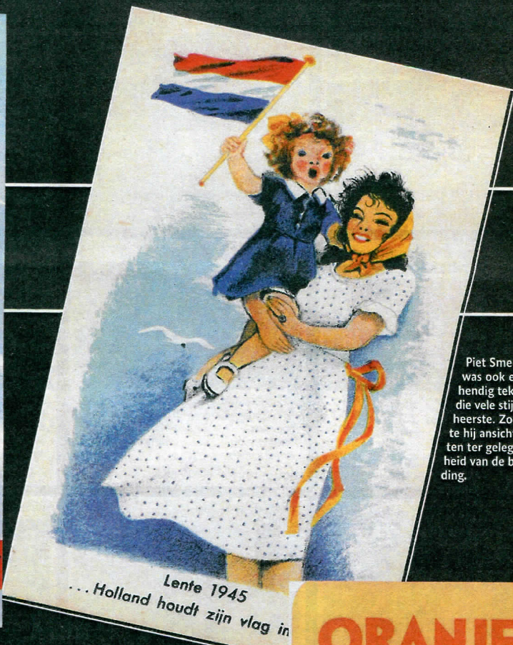
Piet Smeele was ook een behendig tekenaar die vele stijlen beheerste. Zo maakte hij Ansichtkaarten ter gelegenheid van de bevrijding.