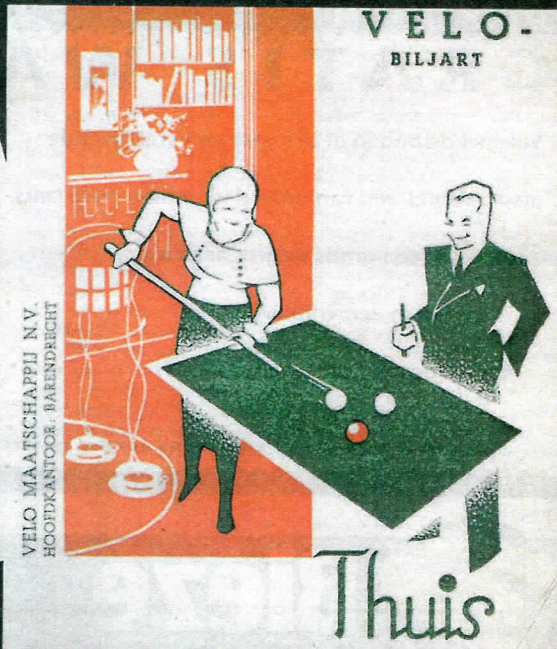
Twee tekeningen in een folder van biljartfabrikant Velo. Links een tafereel van twee biljartende mannen in een kroeg, met de pilsjes binnen handbereik. Rechts is de setting verplaatst naar een huiskamer waar één van de mannen met hetzelfde genoegen biljart met zijn vrouw, ditmaal met de thee binnen handbereik.