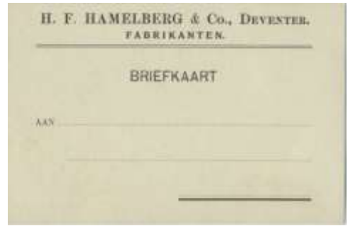
[Diverse foto's materiaal Hamelberg & Co., o.a. een prijscourant uit 1895]