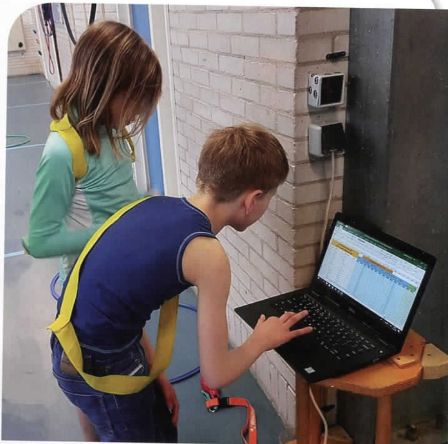
Twee spelers passen hun niveau aan in het leerlingvolgsysteem.

Om het eigen niveau goed in te kunnen schatten, wordt er in de lessen gebruik gemaakt van video. Beelden kunnen vertraagd teruggekeken worden, zodat kinderen niveaus goed in kunnen schatten. Essentieel hierbij is dat kinderen niet elkaar beoordelen. Ten aanzien van de meeste evaluatieactiviteiten zijn de niveaus absoluut, voor spel ligt dat anders, spel is dynamischer. Daarom is het noteren daar vaak ook een kwestie van interpretatie.