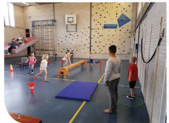
Spelleider groep 8 observeert op twee niveaus: t.w. enigszins weglopen vd tikker en enigszins achterlopers aanlopen.