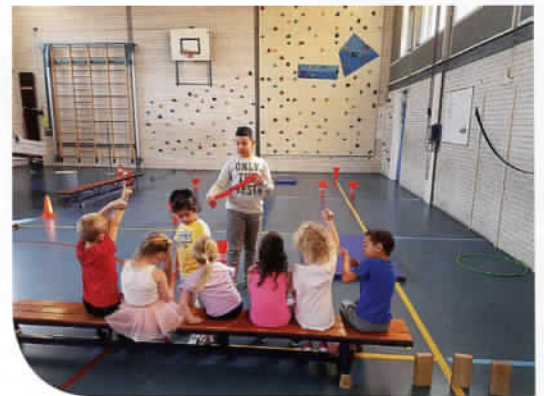
Met spelleider.

Bij het onderdeel spel kan in groep 5-6 bijvoorbeeld het spel Rawhide geoefend worden op twee niveaus: 5. Reactie loper OK en 6. Samenwerking tikker OK.