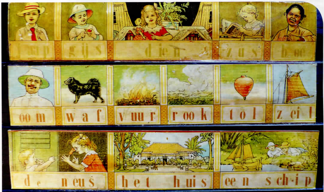
Het 'Indisch leesplankje'.

Misschien is dat wel wat er zo 'dalton' was aan de vorming van kinderen in Voor-Indië 5000 jaar geleden. Toen was er nog geen onderwijssysteem met vakken, waar leraren eindeloos uitleg gaven en die kinderen afleerden om zelf aan de slag te gaan.